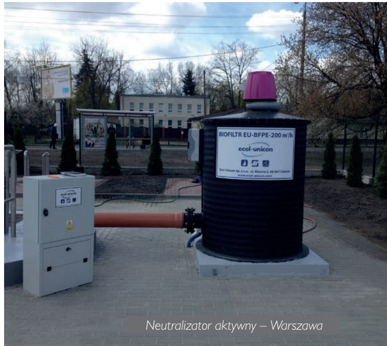
Neutralizator aktywny – Warszawa