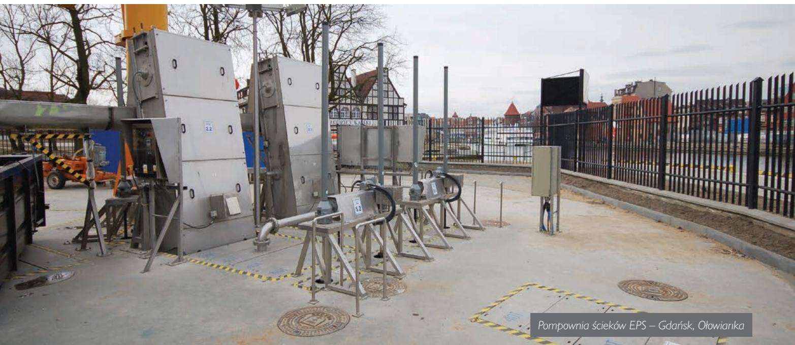
Pompownia ścieków EPS – Gdańsk, Ołowianka